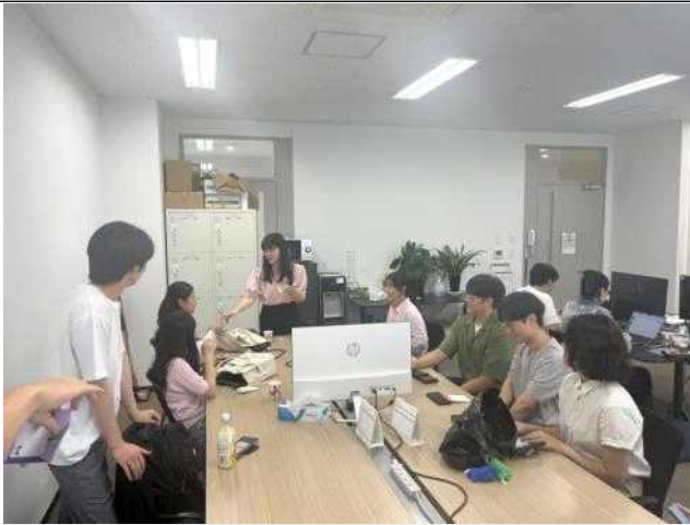
AIS 인턴십 파라소닉기업 탐방