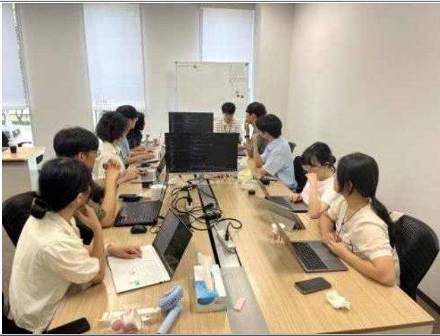
AIS 아이디어 발표회