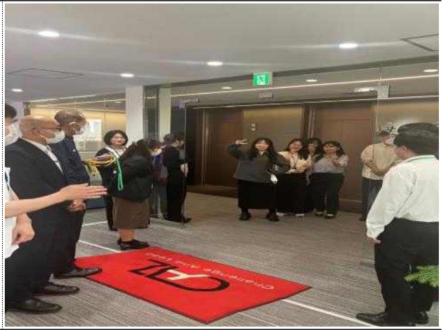
CAL 인턴십 수료증