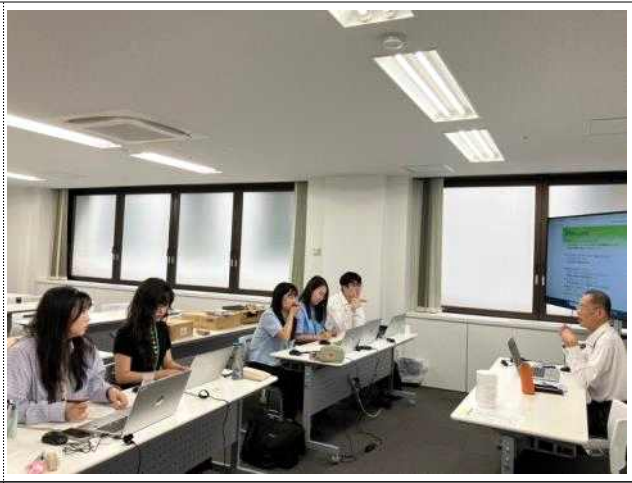
CAL 인턴십 종료 후