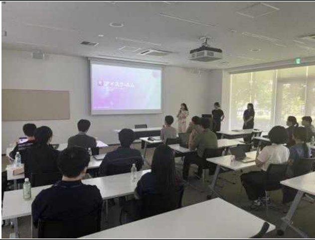
AIS 프로젝트 발표회